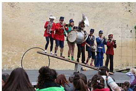
Il était une fois le Val d'Ancoeur