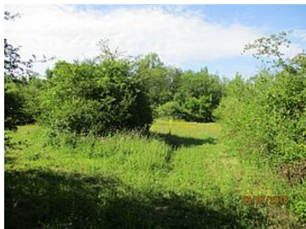
Repérage Val d'Ancoeur

Cliquez sur chaque item pour plus d'infos !